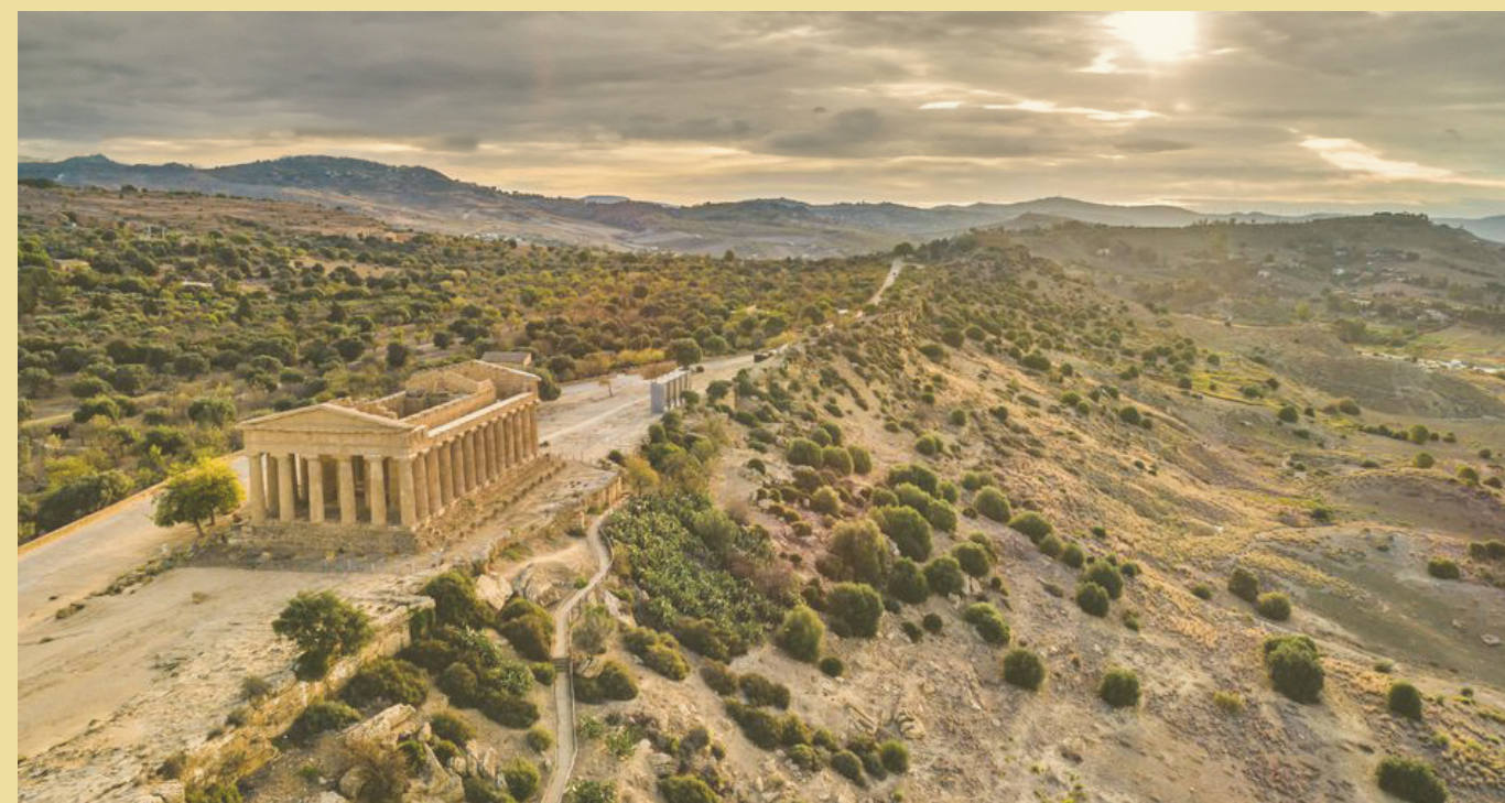
Valle dei Templi - 15 min in auto