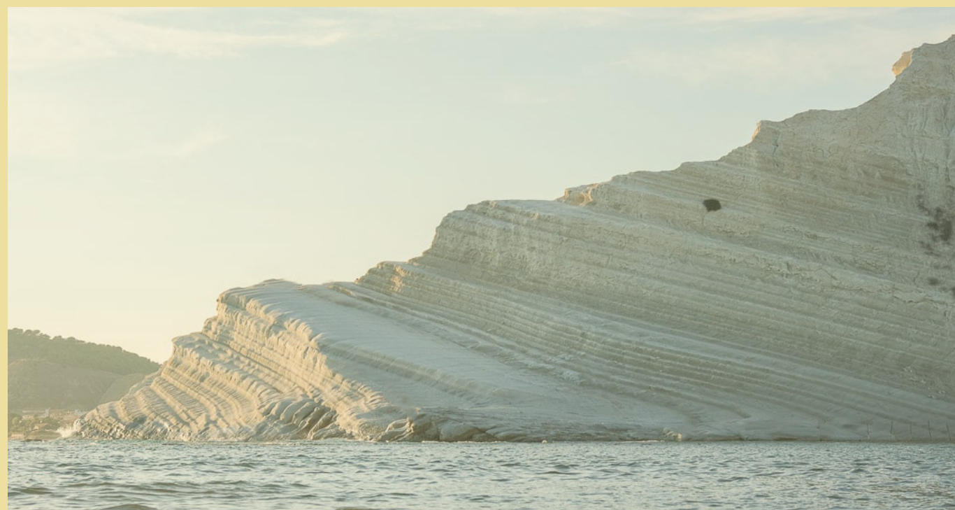
Scala dei Turchi - 15 min a piedi